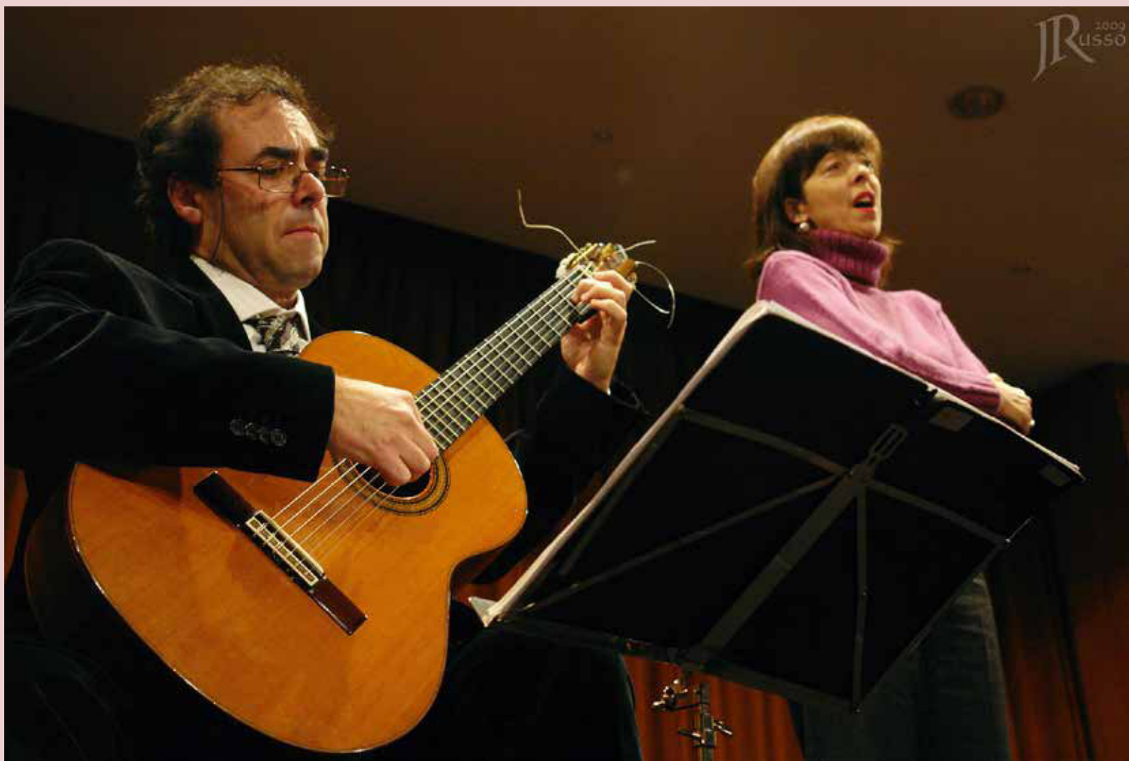
Ensaio em Arouca (2009)